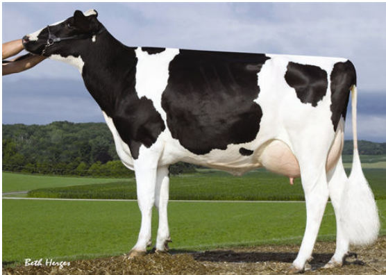
SANDY-VALLEY PLANE SAPPHIRE FOURTH DAM