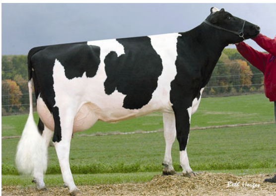
SANDY-VALLEY BOLT SHEILA FIFTH DAM